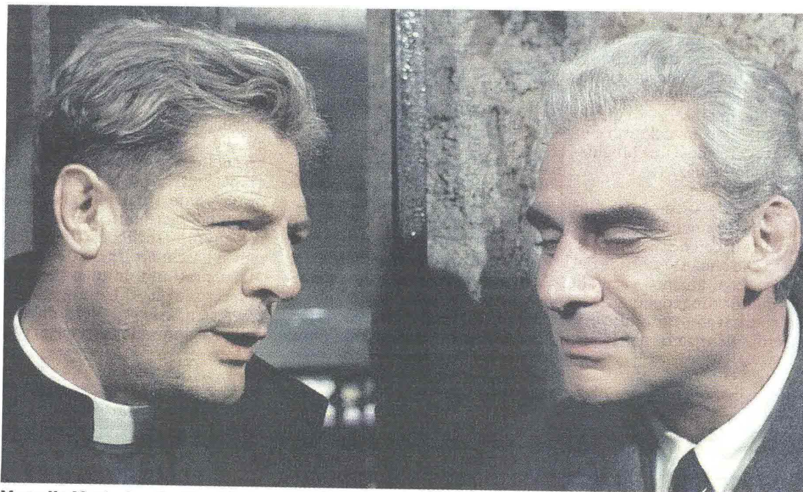
Marcello Mastroianni e Gian Maria Volonté, don Gaetano e M. il Presidente in una scena di "Todo modo", il film che Elio Petri diresse nel '76, ispirandosi liberamente al romanzo di Sciascia

L'AURA 'maligna' che aleggiava sul film non coinvolse soltanto gli aspetti più 'politici' ma si diffuse addirittura sulla colonna sonora. Che inizialmente era stata affidata al grande jazzista Charles Mingus che arrivò a Roma e registrò alcuni brani (inseriti poi nel disco "Music for Todo modo"). Quei brani non arrivarono mai sullo schermo e venne commissionata una nuova colonna sonora affidandola a Ennio Morricone. Note maledette per un film scomodo.